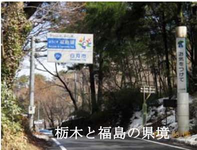
栃木と福島の県境