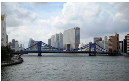
史跡展望公園より清洲橋を望む