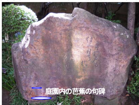
庭園内の芭蕉の句碑