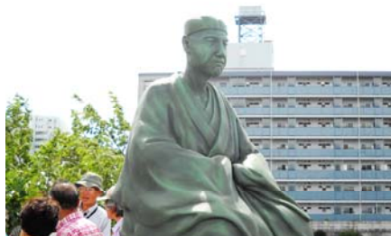
史跡展望公園の芭蕉像

清澄庭園よりスカイツリーを望む。昼食休憩の後、徒歩で仙台堀川に架かる清澄橋に行き、海辺