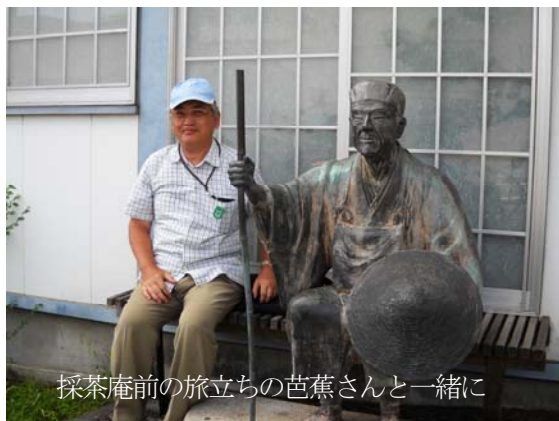
採茶庵前の旅立ちの芭蕉さんと一緒に