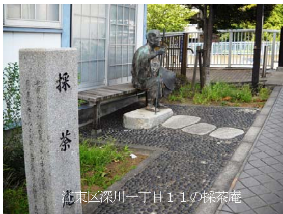
江東区深川一丁目11の採茶庵

まず、荒川区南千住六丁目の平安時代に創建されたと言う すさのお神社 にお参りする。ここには千住大橋と奥の細道のミニチュア版があります。