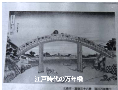
江戸時代の万年橋