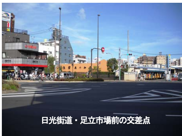
日光街道・足立市場前の交差点