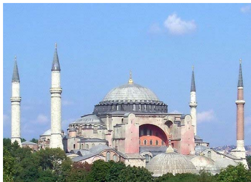
アヤソフィア大聖堂

ヤニーの内部を見たかったが、(王様は一国の王、帝国は幾つもの国を支配する者の名稱) ツアーの行程になく残念乍ら見れなかった。兎に角モスク内張りタイルの美しさは素晴らしい。天才建築家シナンは石工や大工、彫刻家は地位、年齢、宗派に関係なく秀でた者のみを使った。従って作業者の中には沢山のキリスト教徒もいたらしい。尚、此の美しいタイル製造技術は当時の職人が自分の技術を保持したく、弟子に伝承し無かったので未だその製法は不明である。