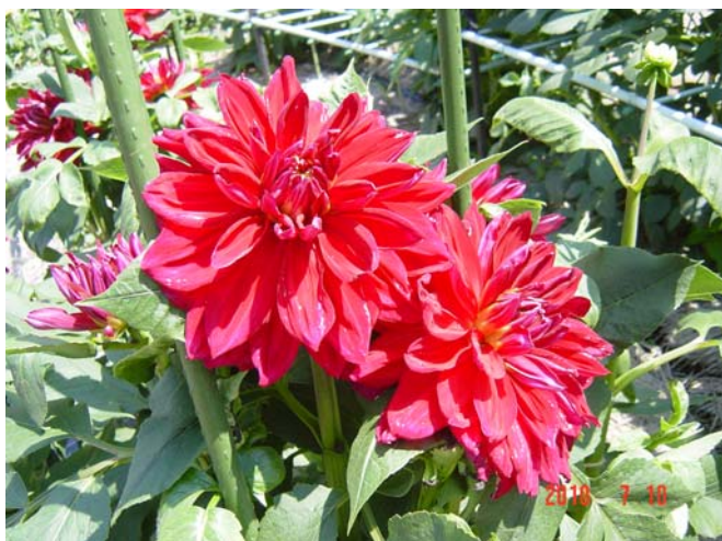
町田ダリア園にて、品種名称は“熱意”