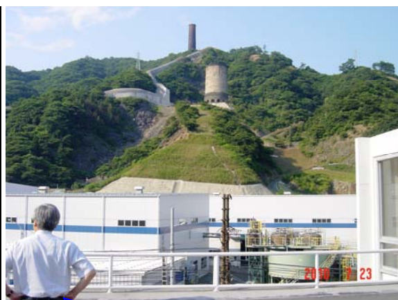
HMC工場事務棟屋上より大煙突を望む